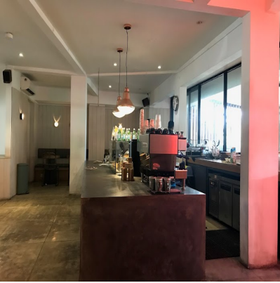
Café di sebelah selatan Jakarta : Woodpecker Coffee