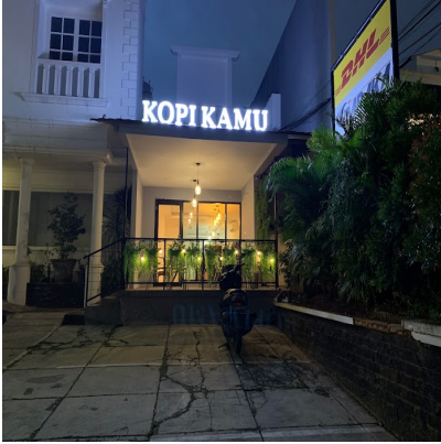
cafe in South Jakarta : Kopi Kamu Wijaya Jakarta Selatan