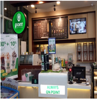
“Coffee shop located in South Jakarta” : Point Coffee