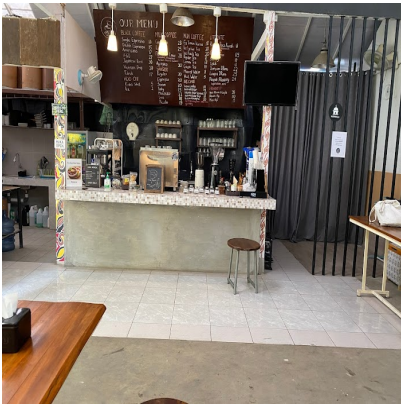
Kedai kopi di Jakarta Selatan : Fakultas Kopi Jakarta