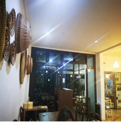
kedai kopi di Jakarta Selatan : Yoshi! Coffee